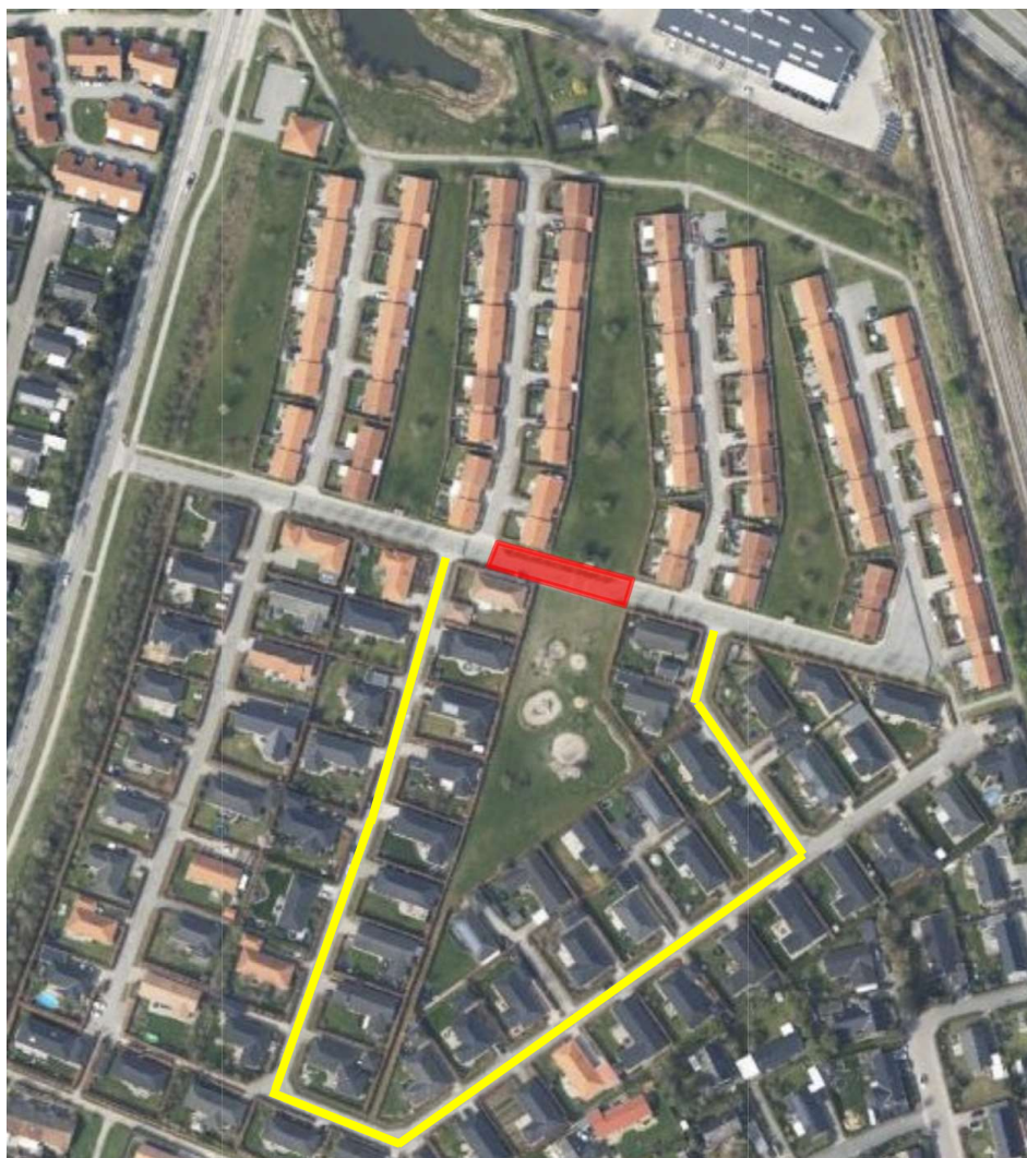
Figur 2 - Afspærret område er markeret med rød. Omkørselsvej er markeret med gul.